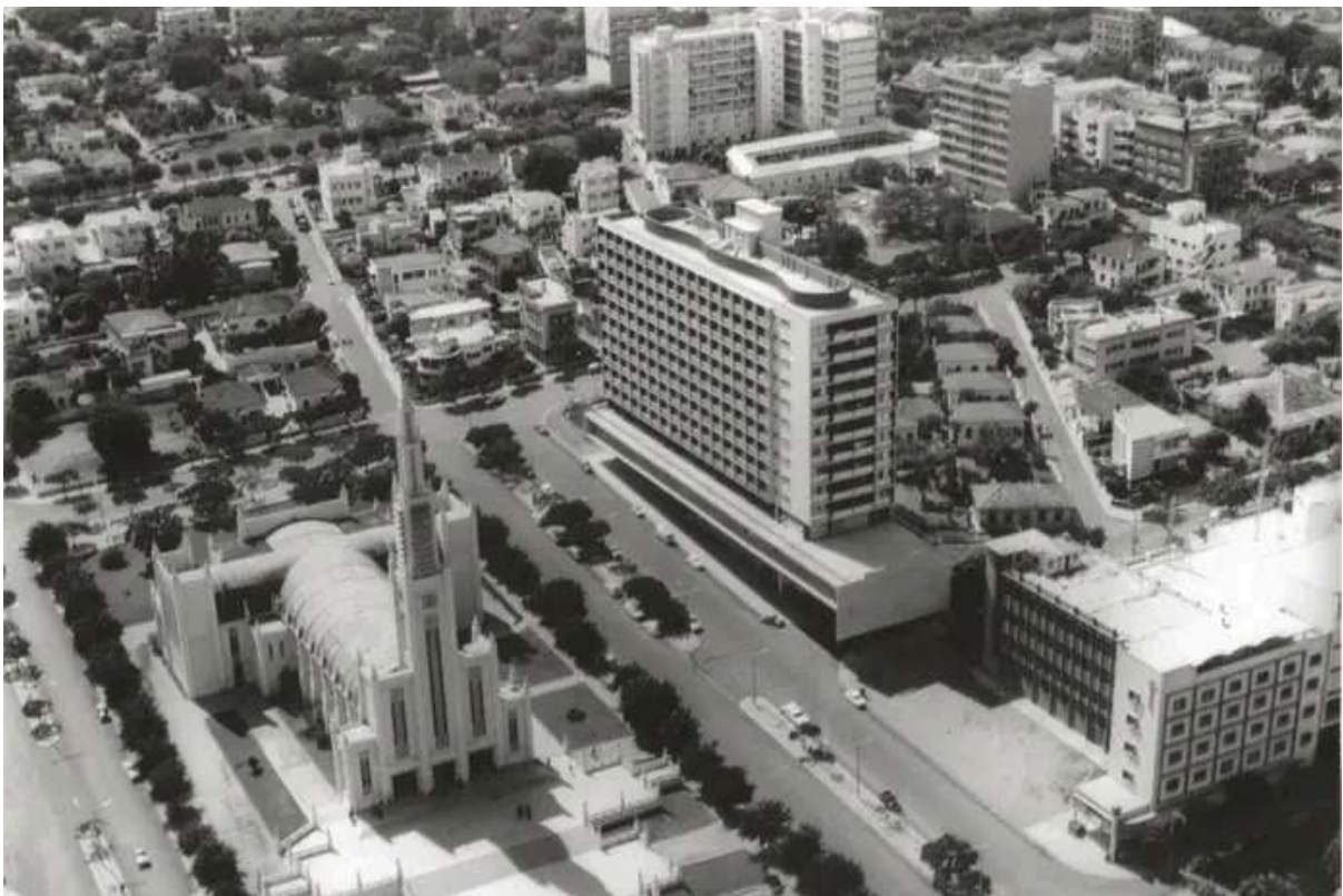
Lourenço Marques, atual Maputo

Cerca de 70 mil páginas de legislação produzida por Portugal para todos os territórios colonizados, em África e Ásia, foi digitalizada, e pela primeira vez passa a estar disponível ao público