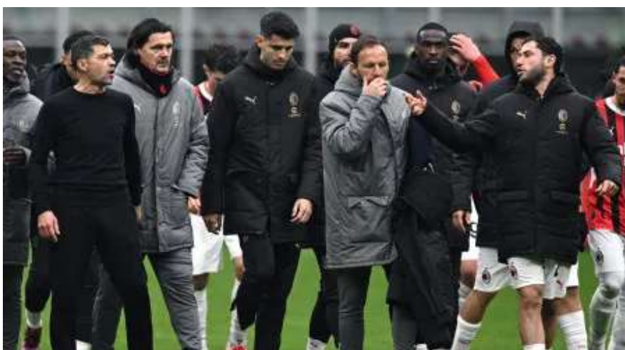
DESPORTO SERIE A

Já nem desliza? Aprenda a limpar a base do ferro de engomar