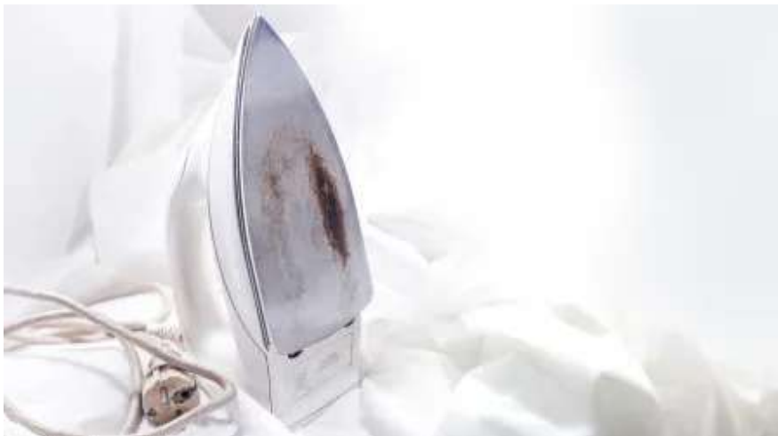
LIFESTYLE DICAS E TRUQUES DE LIMPEZA

João Baião de saída da SIC? Apresentador faz esclarecimento